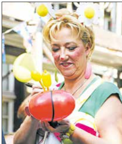
Die Ballonfrau konnte mit ihren Kreationen Kinder und Erwachsene begeistern.

Inzwischen sind es 22 Männer und Frauen, die sich durch die MitarbeiterInnen in den Fragen des alltäglichen Lebens in den eigenen