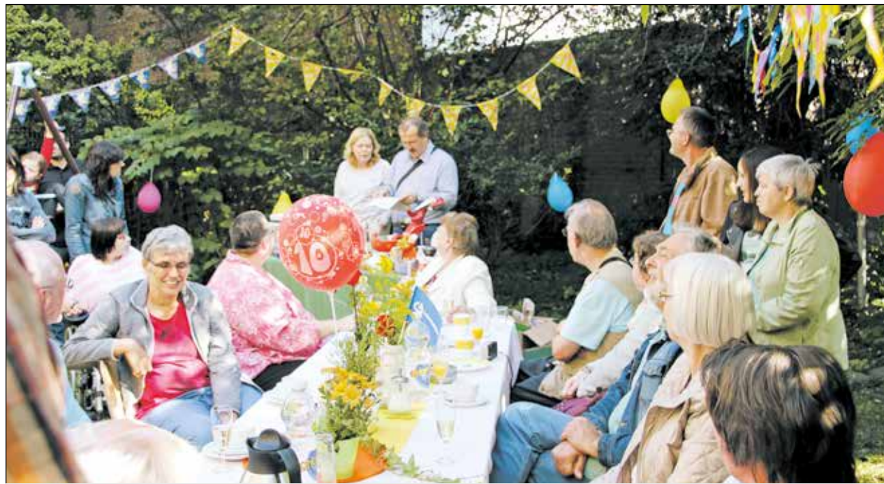
Bei schönem Wetter genoss man im Garten bei Kaffee und Kuchen das unterhaltsame Programm.

vier Wänden unterstützen lassen. Diese erfolgreichen zehn Jahre waren nun Anlass genug, um einmal gemeinsam zu feiern. Bei spätsommerlichem Wetter trafen sich ABWler, MitarbeiterInnen, Angehörige, Freunde und Nachbarn, um es sich bei Kaffee, Kuchen, Gegrilltem und Salaten im Garten des Treffpunkts gut gehen zu lassen. Feierliche Au-